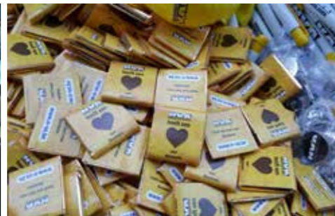
▲ Geschenkjjes en chocolade voor de Meulebekenaren.